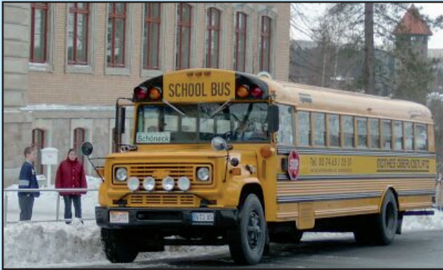
Haltestellen für die Schulbusse direkt vor der Schule