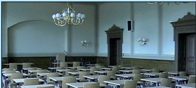
Die Aula der Seminarschule

Unser Schulgebäude ist seit dem Jahr 2000 ein bauliches Schmuckstück, mit modernsten Fachkabinetten, einer Großsporthalle, mit hellen Gängen und Klassenzimmern, mit einer denkmalgeschützten Aula, einem Schulclub, mit Aufenthalts- und Speiseräumen und weitläufigen Außenanlagen ausgestattet.